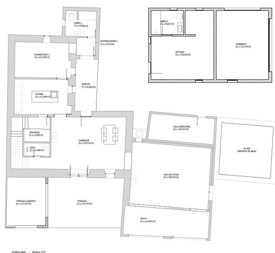
PIANTA PRIMA - Scala 1/75