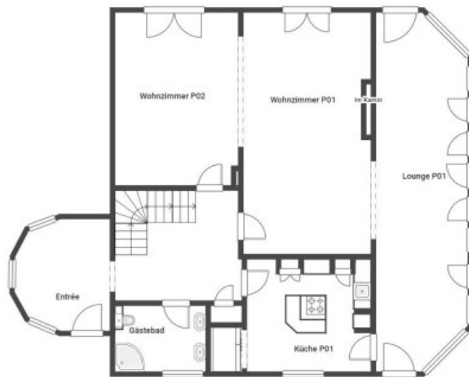
Erdgeschoss inkl. Atelier