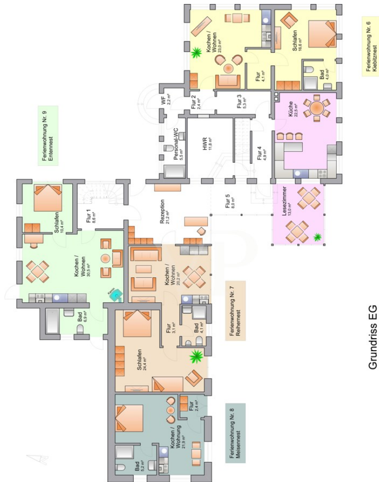
Grundriss EG Hauptgebäude