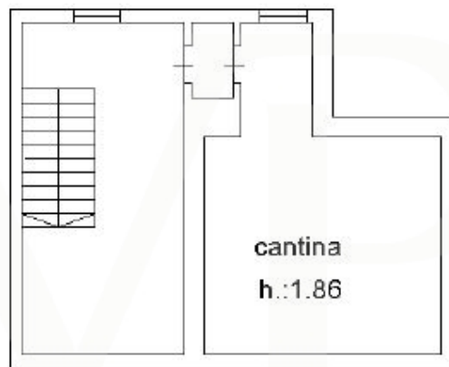
PIANO 1 SOTOSTRADA

Dieser Grundriss ist nicht maßstabsgetreu. Die Unterlagen wurden uns vom Auftraggeber zur Verfügung gestellt. Aus diesem Grund können wir nicht für die Richtigkeit der Angaben garantieren.