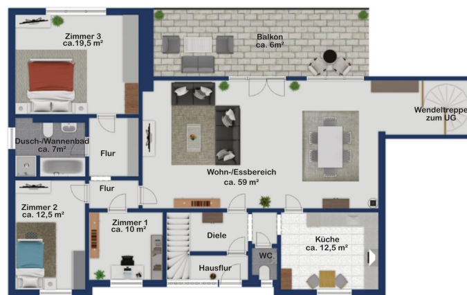
Exposé plan, nicht maßstäblich